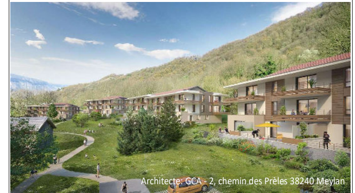
Architecte: GCA - 2, chemin des Prêles 38240 Meylan